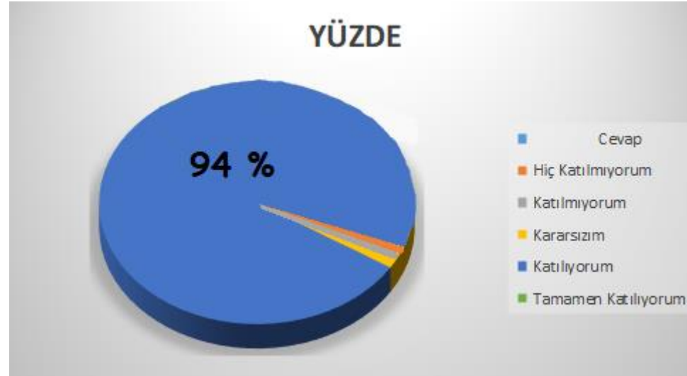
Şekil 2: Katılımcı Karar Alma Seviyesi

Okulumuzda görev yapmakta olan toplam 19 öğretmenin tamamına uygulanan anket sonuçları aşağıda yer almaktadır.